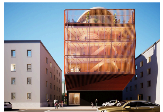
RENDERING VON KERE ARCHITECTURE

Direkt neben der Mensa am Stammgelände entsteht derzeit ein echtes Highlight für alle Uni-Eltern: Die neue Kita “ Kinderoase an der TUM ” öffnet voraussichtlich zum September 2026 ihre Türen. Mit diesem Neubau erweitert die Universität ihr Kinderbetreuungsangebot deutlich und setzt ein starkes Zeichen für die Vereinbarkeit von Studium, Beruf und Familie. Unter der Trägerschaft des Studierendenwerks bietet die neue Kita Platz für bis zu 60 Kinder von Hochschulangehörigen im Alter von 0/1 bis 6 Jahre – verteilt auf eine Krippen- und zwei Kindergarten-Gruppen. Das Gebäude selbst ist ein architektonisches Erlebnis auf fünf Ebenen, lichtdurchflutet und modern, mit einer großen Dachterasse, die als geschützte Außenspielfläche dient.